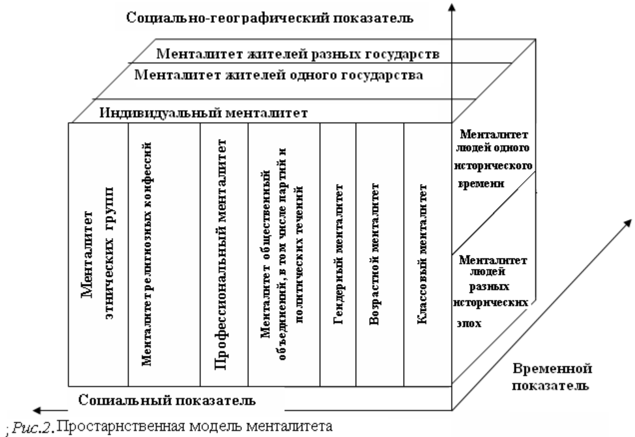
Рис.2. Пространственная модель менталитета