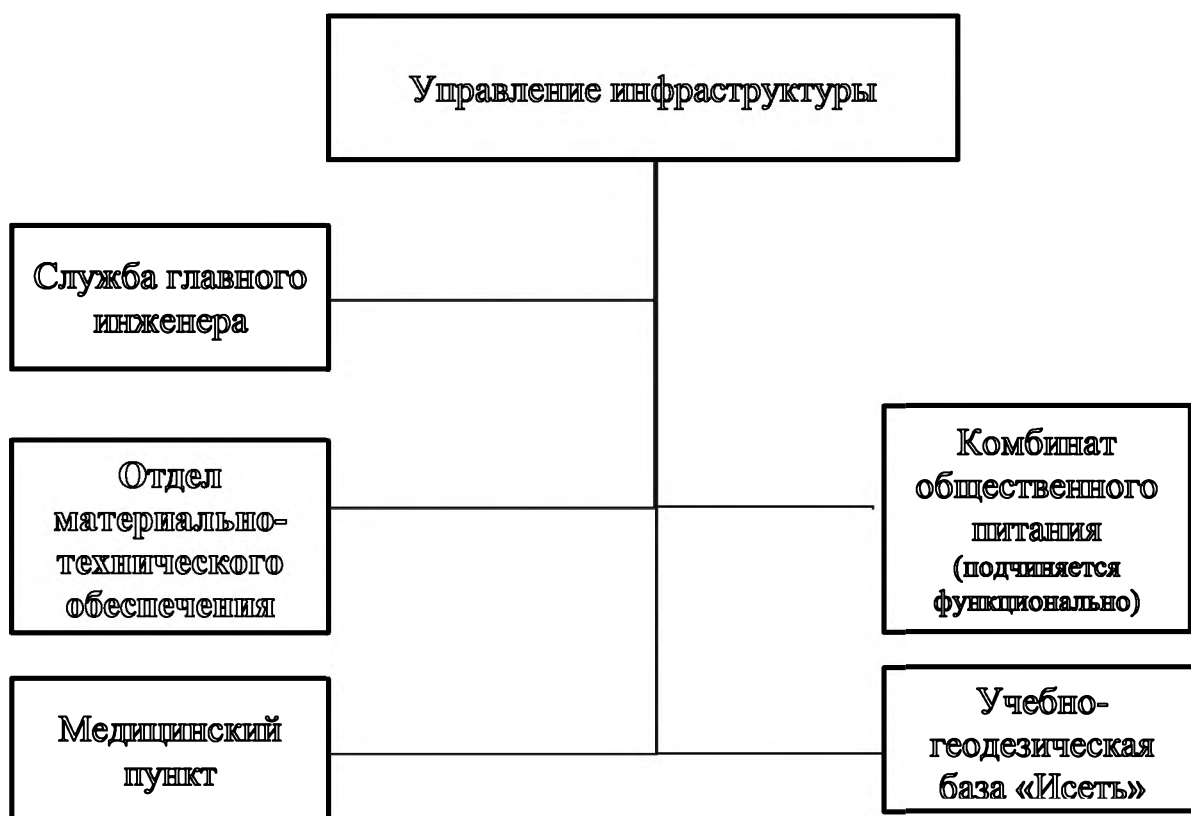
Рисунок 1 – организационная структура Управления

4.1 В состав Управления входят структурные подразделения в соответствии со штатным расписанием Университета, представленные на рисунке 1.